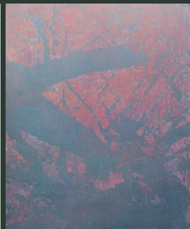
1. Sudi | Soul | Photograph 2. Alice Maher | Rokuro-Kubi | Etching 3. Katsutoshi Yuasa | 16 Zakura | Woodblock