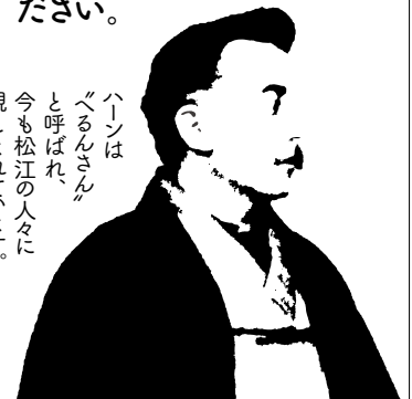
LAFCADIO HEARN 小泉ハ雲 1850-1904